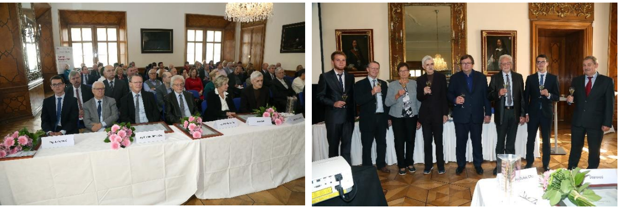
Společná fotografie oceněných